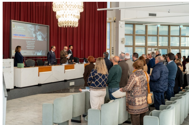
Un ricordo per i medici deceduti nel 2025